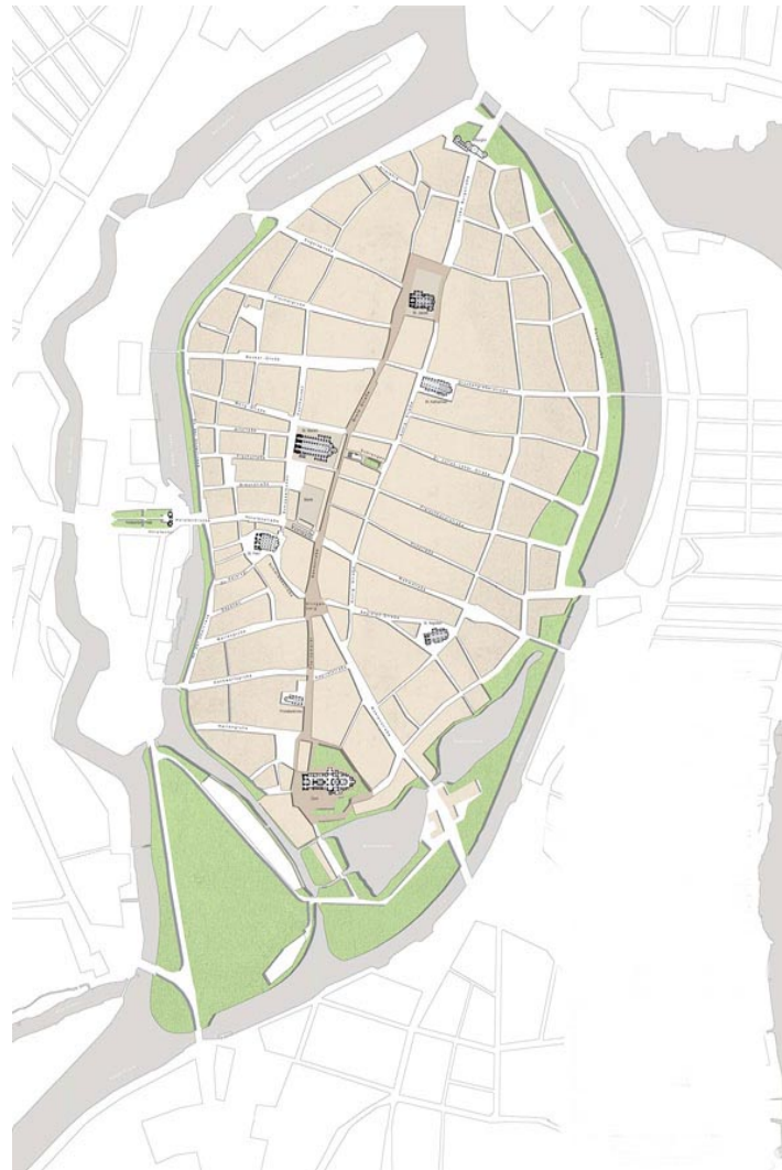
mitten in lübeck