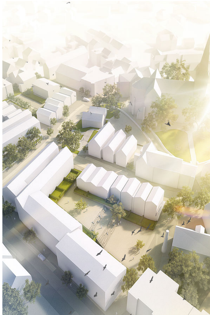
sankt jakobusquartier ennigerloh

das kostbare anltiz von ennigerloh, stadträumlich und topographisch entschieden geprägt durch die st. jakobuskirche und den die kirche umgebenden "drubbel" wird mit den baulichen interventionen des neuen st. jakobusquartieres den hüllblättern einer blüte gleich behutsam ergänzt. das neue quartier arrondiert dabei maßstäblich die stadtstruktur, würdigt signifikant die hierarchische silhouette der altstadt in anlehnung an den historischen stadtgrundriss und formuliert einen eindeutigen bezug zwischen dem quirligen merkantilen nutzungsgefüge auf dem rathausmarkt und der kontemplativen ruhigen milieu auf dem kirchhügel.