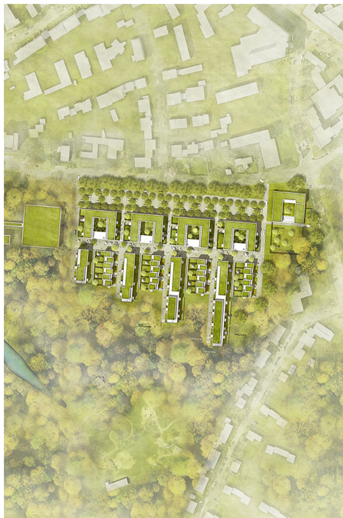
wohnen am westfalenpark