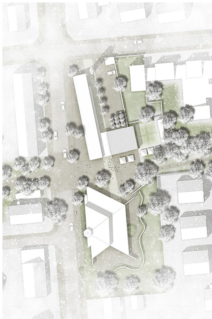
gemeindehaus neustadt a. rbg.

im spannungsfeld zwischen kirchturm und kirche entwickelt sich das gemeindehaus als gestreckter linearer baukörper mit extern gelagertem und damit gebührend hervorgehobenem gemeinde-saal. das foyer wird zum verteilerknoten der angelagerten