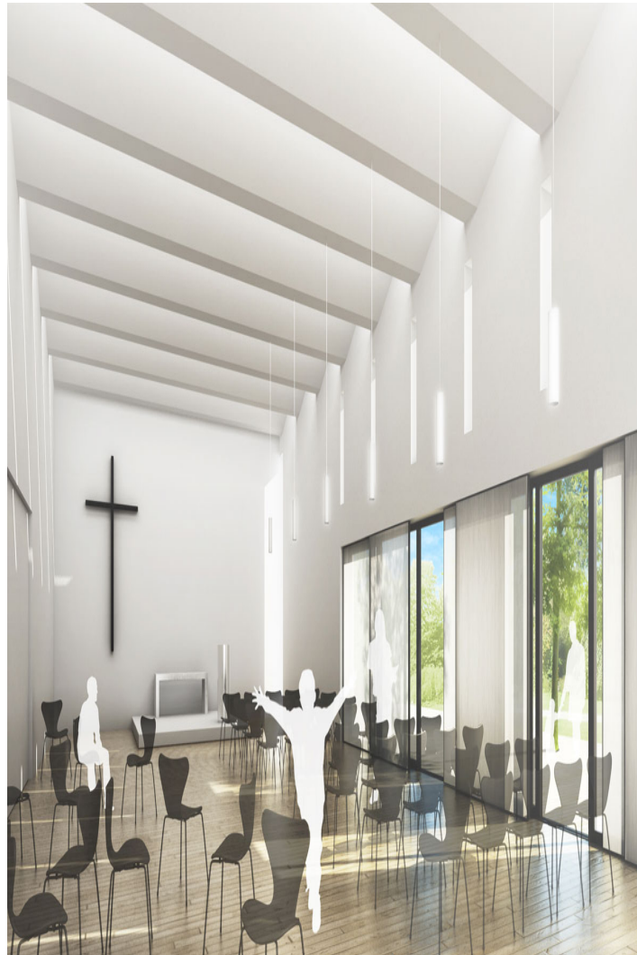
st. nathanael kirchenzentrum

hier, in der glaubensstiftenden mitte von bothfeld, wird aufgrund neuer nutzungsanforderungen an den ort die städtebauliche lösung eines neuen st. nathanael quartiers manifest und in den focus der betrachtung gestellt. auf ein neubebauung mit geneigten dächern, die das kirchenzentrum optisch aus dem sichraum ausblendet oder ihre stadträumliche präsenz entwertet, wird aus diesem grund bewußt verzichtet. die vorzüge einer sorgsam hierarchisierten ensemble-bildung des neuen st. nathanael quartiers, einhergehend mit einer ganzheitlich geprägten baulich-räumlichen fügung, gestalterisch abgestimmt aufeinander in der materialität und architektur, liegen auf der hand und gehen einher mit den städtebaulichen notwendigkeiten der entwurfsidee. die flachdächer aller hauptgebäude werden extensiv begrünt und tragen jeweils auf teilflächen fotovoltaik-paneele stets nach süden ausgerichtet. eine " himmlische ausnahme " bildet die decke über dem saal + altarbereich, das " h i m m e l d a c h