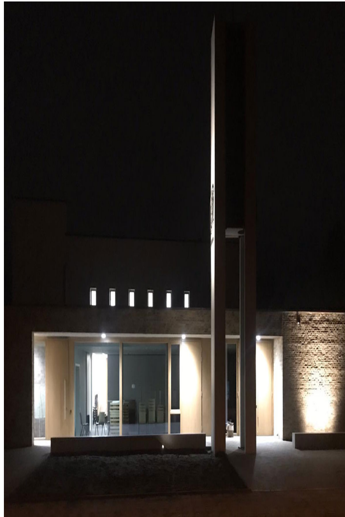
st. nathanael kirchenzentrum

über dem saal + altarbereich, das " h i m m e l d a c h