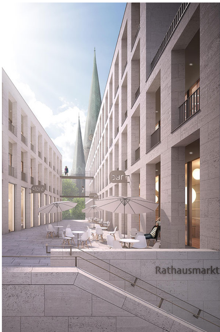
marktcarré am rathausmarkt

helene und karl_ die große freitreppe überführt die breit gelagerte treppe am rathausmarkt in die vertikale, leitet in die tiefe des raums auf das obere marktplateau, und sichert allen einheiten die einprägsame, besondere adresse am rathausmarkt, mit blick nach süden auf die identitätsstiftende lambertikirche. analog zur böttchergasse in bremen präsentiert sich hier, auf urban verdichtetem raum, ein vielfältiges angebot variabel zu nutzender flächen. der blick vom marktcarré über die dächer der stadt wird zum neuen attraktivitätspot oldenburgs.