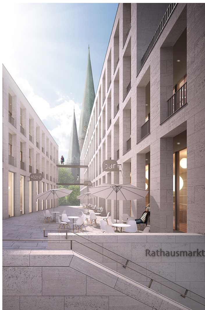
marktcarré am rathausmarkt

helene und karl_ die große freitreppe überführt die breit gelagerte treppe am rathausmarkt in die vertikale, leitet in die tiefe des raums auf das obere marktplateau, und sichert allen einheiten die einprägsame, besondere adresse am rathausmarkt, mit blick nach süden auf die identitätsstiftende lambertikirche. analog zur böttchergasse in bremen präsentiert sich hier, auf urban verdichtetem raum, ein vielfältiges angebot variabel zu nutzender flächen. der blick vom marktcarré über die dächer der stadt wird zum neuen attraktivitätspot oldenburgs.