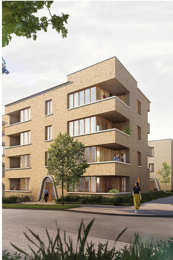
areal mitte - baufeld b.2

rücksprünge, fassadenrelief und vorkragende gesimse als dachrand harmonisieren bei hangigem gelände die hausspezifischen ansichten, bogenartig überspannte hauseingänge fokussieren den blick auf dieses wesentliche element des jeweiligen Hauses und geben den geschosswohnbauten wie auch den reihenhäusern einen charakteristische, verbindende prägung.