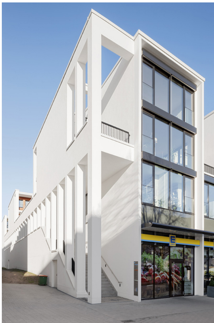
forum herrenhäuser markt

für herrenhausen wird damit ein ganzheitlicher lösungsansatz fertiggestellt. städtebaulich vereint das neue quartier den westlichen mit dem östlichen stadtteil, definiert eine neue attraktivität für