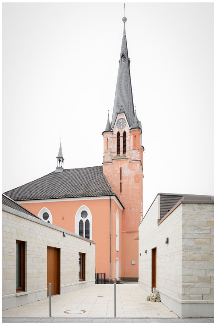
kita und gemeindehaus in hainholz