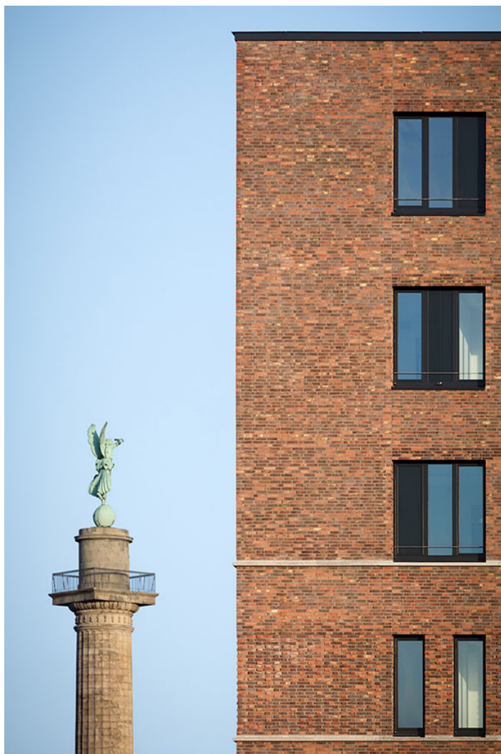
hannovers neuestes rathaus

das "neueste rathaus" hannovers gliedert sich in seiner struktur in niedrig lagernde baukörper mit drei turmaufsätzen, die zusammen mit den highlights der stadt - aber vor allem mit der kuppel des rathauses - in der annäherung an die innenstadt hannovers miteinander in beziehung treten und stetig wechselnde, lebhaftere perspektiven bieten. das gebäude ist aufgrund seiner prominenten lage rundum mit schauseiten ausgestattet.