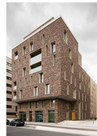
pelikanviertel - pelikan vier