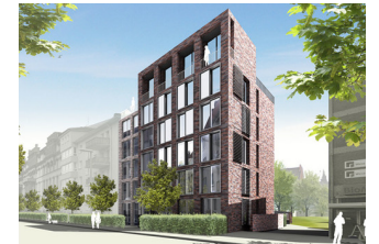
alte döhrerer straße