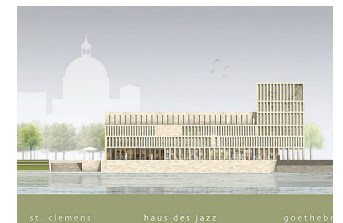
st. clemens haus des jazz goethebi