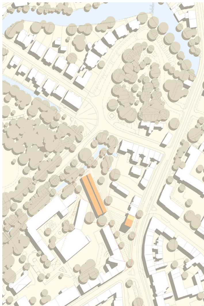
herberge am inselwall

auf dem vorbeschriebenen weg prominenter, städtebaulicher wertschöpfung an diesem ort durch zwei sich einander ergänzende prägnante und